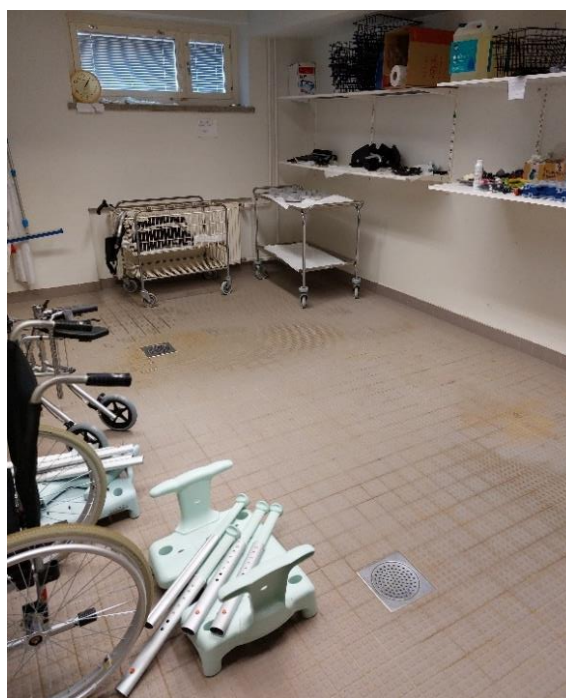
Bild 11. Tvättrum för hjälpmedel.