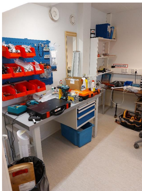
Bild 14. Översikt av hjälpmedelsförrådet. Bild 15. Underhållsrum för hjälpmedel.