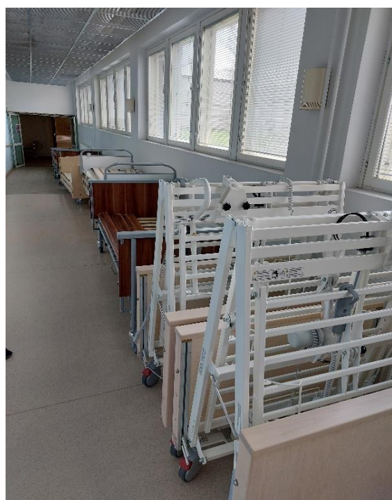
Bild 10. Hjälpmedel i korridoren.