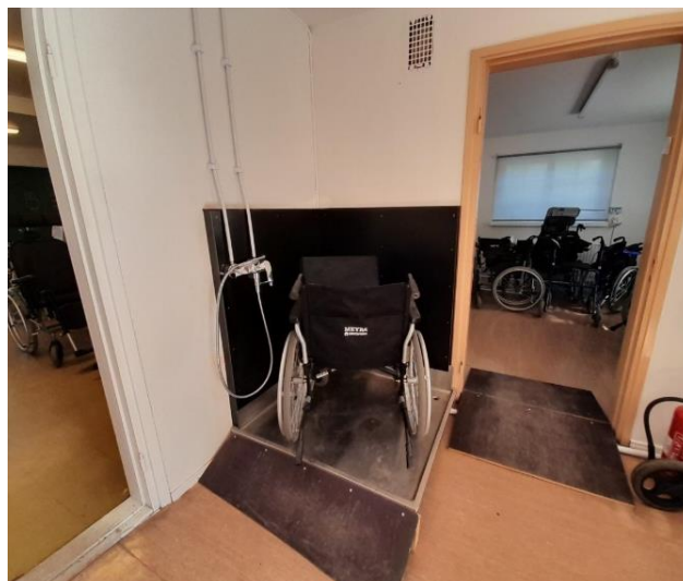
Bilder 6–7. Översiktsbild av det större hjälpmedelsförrådet i västra området.