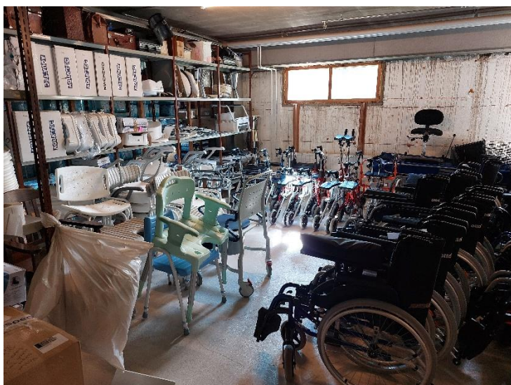
Bilder 12–13. Översiktsbild av hjälpmedelsförrådet i Askola.

Personal: I Askola tar fysioterapeuterna inom medicinsk rehabilitering tillsammans hand om hjälpmedelsutvärderingar och utlåning. Chefen tillsammans med de anställda svarar för hjälpmedelsbeställningarna och hjälpmedelsförrådet.