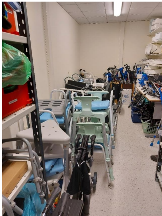
Bilder 4–5. Översiktsbild av det mindre hjälpmedelsförrådet i västra området.