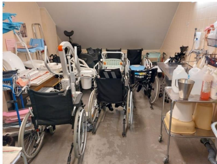
Bilder 1–3. Översiktsbild av hjälpmedelsförrådet och -tvättrummet i mellersta området.